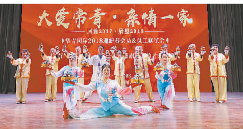
本报(记者于建雪)2月8日下午,魅力18载常青国际2018迎新春会员员工联谊会暨“24节气、56民族”免费

会,学校礼堂座无虚席。联谊会在该集团员工精心准备的歌舞《走进新时代》中拉开了序幕。常青国际集团的宣传片展示了该集团成立18年来的发展成果和不忘初心、回馈社会的企业精神。接下来,歌舞《格桑花》、绝活表演《保定铁球亮闪闪》、诗朗诵《最美茶溪谷》等10余个节目异彩纷呈,赢得观众阵阵掌声,同时展示了常青国际团结奋进的企业文化和员工们艰苦创业的精神风貌。联谊会在大合唱《相亲相爱一家人》中落下帷幕。